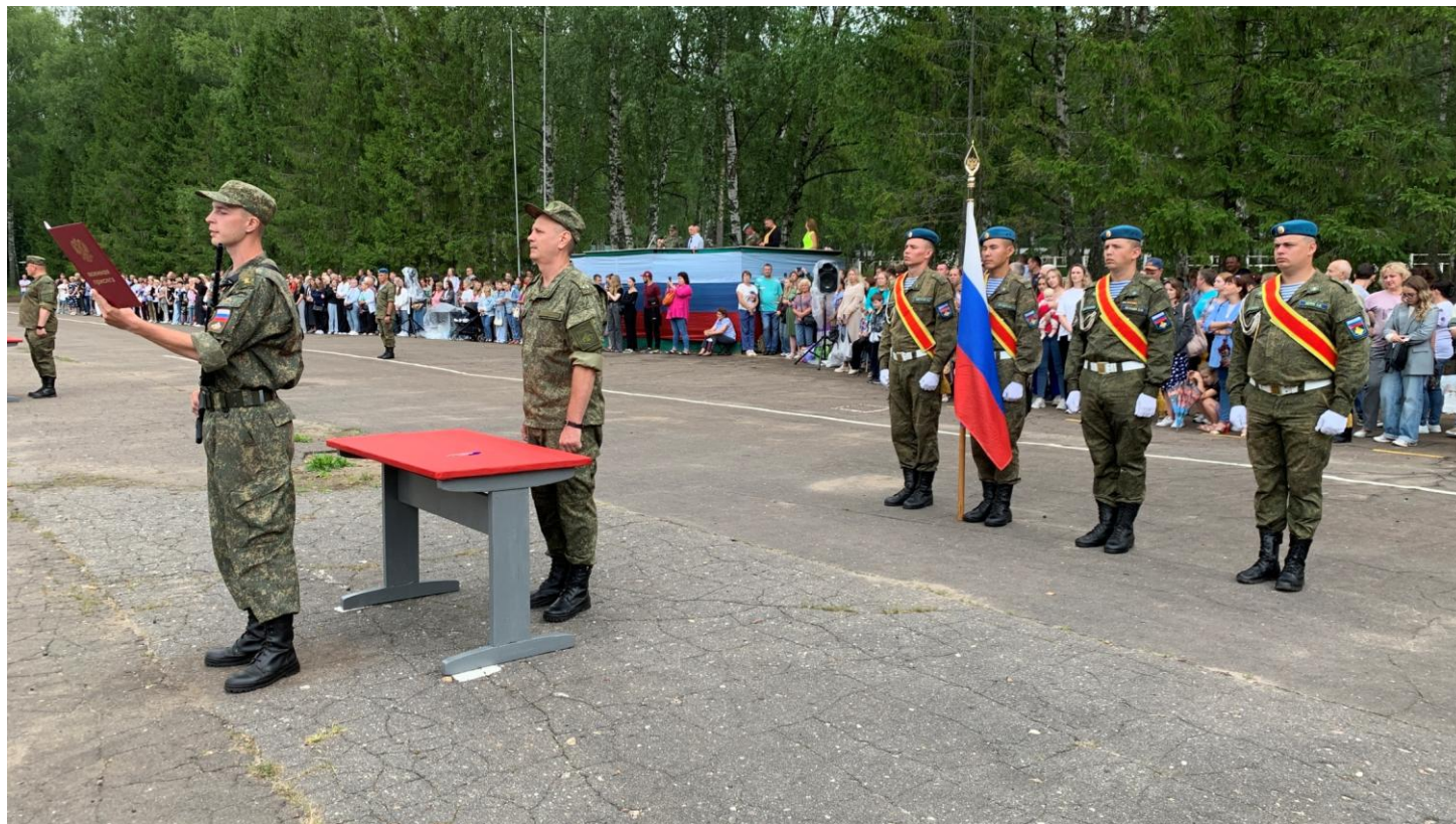
Приведение курсантов ВУЦ к Военной присяге