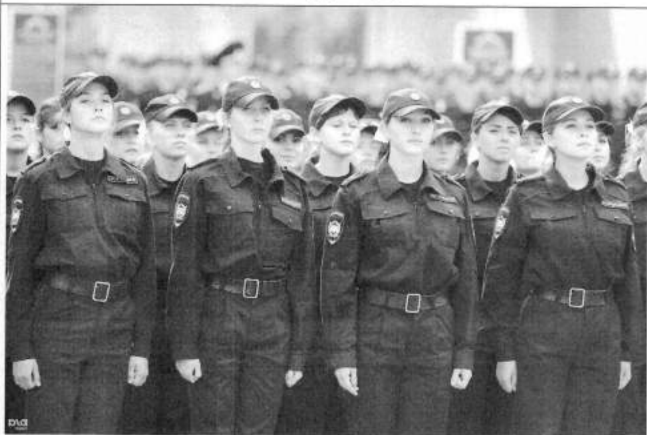
Повседневная форма профиля МВД