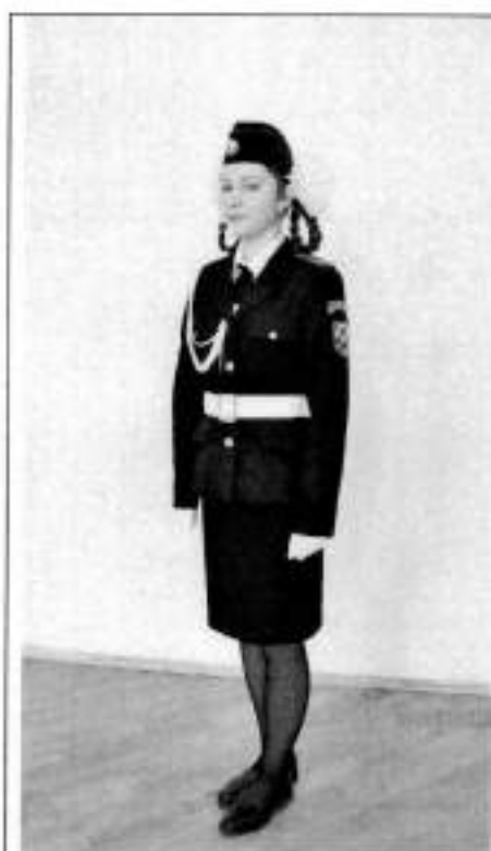
Парадная форма одежды для девочек в юбке