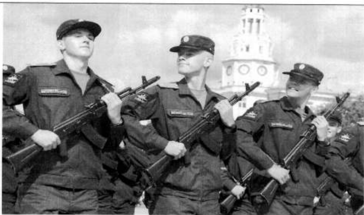
Повседневная форма профиля ВКС