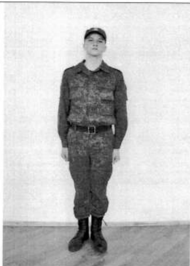
Полевая форма одежды для мальчиков