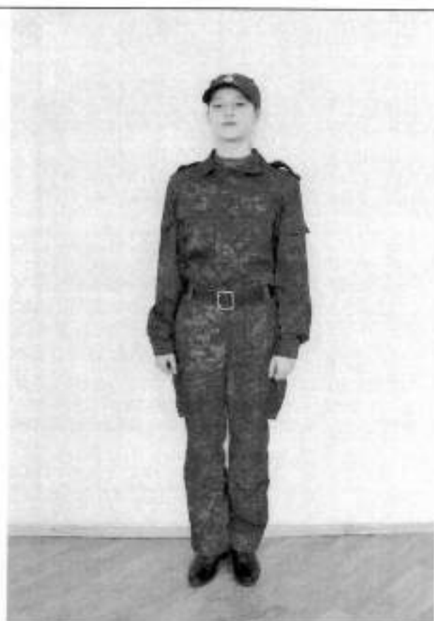
Полевая форма одежды для девочек