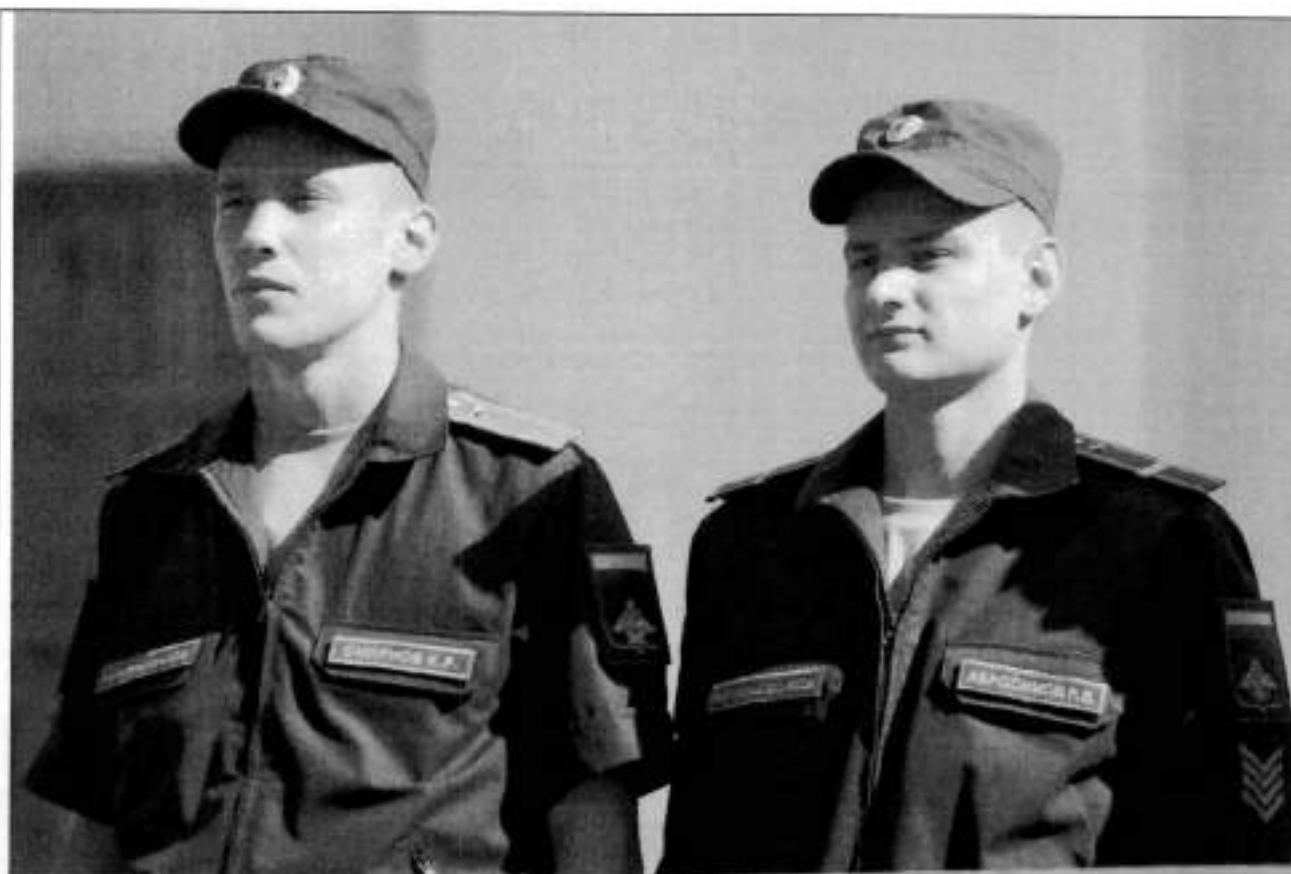
Повседневная форма профиля СВ