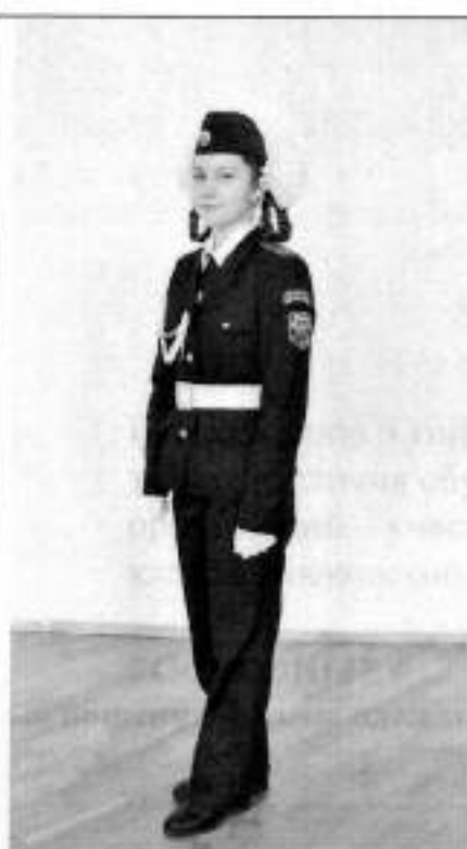
Парадная форма одежды для девочек в брюках