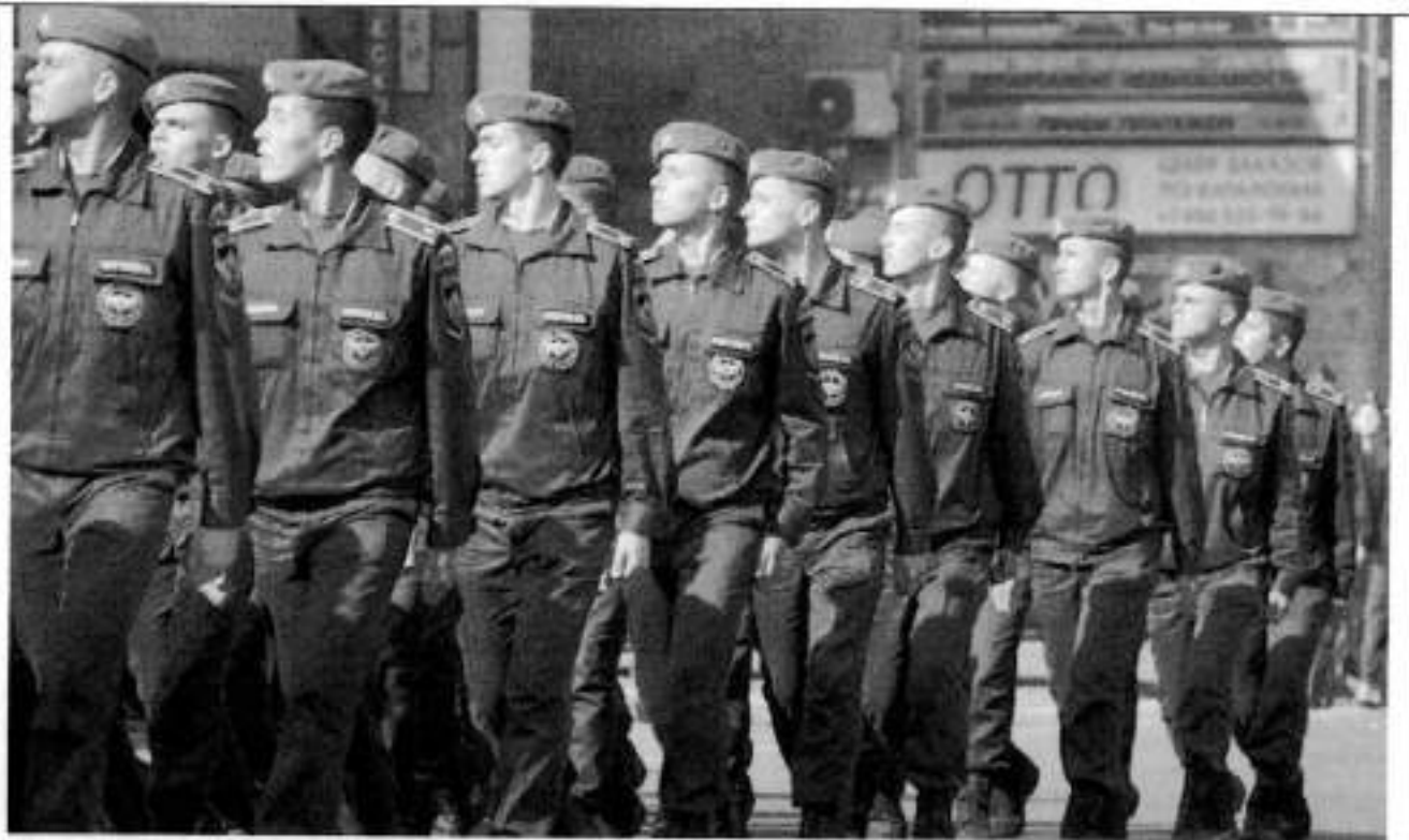
Повседневная форма профиля МЧС