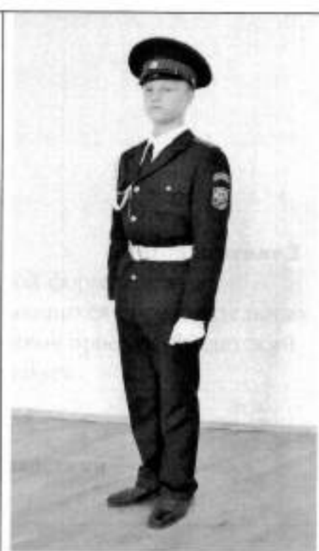
Парадная форма одежды для мальчиков